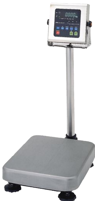
Весы серии HV-WP Рисунок 1 – Общий вид весов

Конструктивно весы состоят из грузоприемного устройства и индикатора с сенсорной клавиатурой на стойке. ГПУ, в свою очередь, состоит из грузопередающего устройства и весоизмерительного устройства с весоизмерительным датчиком (далее датчик).