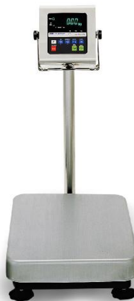
Весы серии HW-WP

Весы снабжены следующими устройствами (в скобках указаны соответствующие пункты ГОСТ Р 53228-2008):